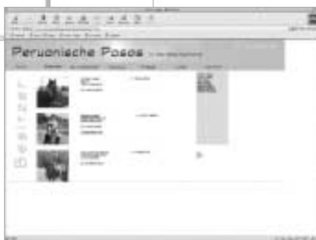
Besitzer stellen sich und ihre Pferde auf einer eigenen Seite vor.