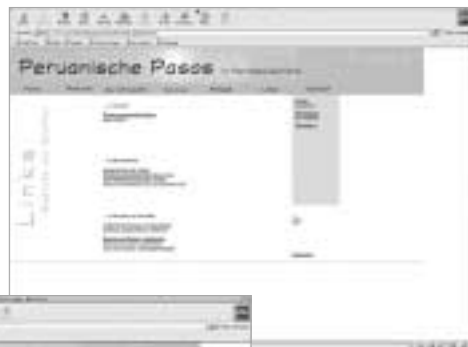
Umfangreiche Link-sammlungen fördern zum Stöbern auf.