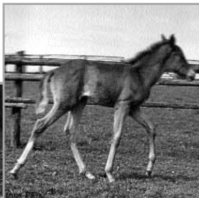
Diadema PT , geb. 1997 Fuchsstute aus der Diana DLG