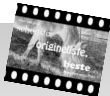
Bild- und Nutzungsrechte gehen an die PPV über. Die Bilder werden ins PPV-Archiv aufgenommen und bei Bedarf in Artikeln über die Paso Peruanos veröffentlicht.

Die drei besten Bilder werden prämiert und den Gewinnern winken schöne Preise: