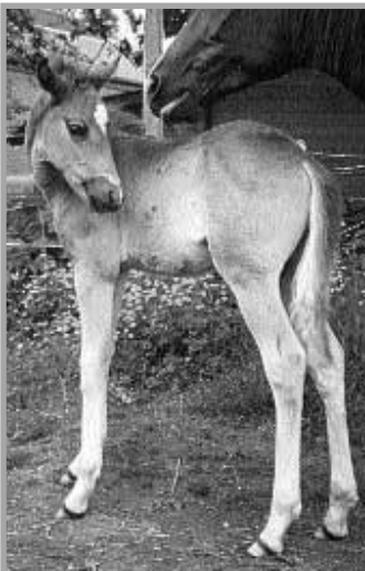
Romancero HK geb. 1998, Fuchshengst aus der Marequita PT